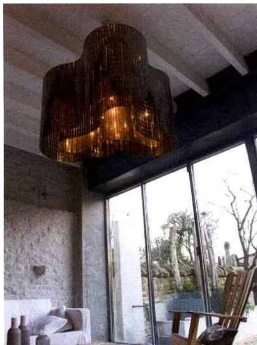
Zoom sur la cotte de mailles © Le Labo Design

La cotte de mailles peut désormais prendre une multitude d'aspects. Outre la fameuse maille, l'on voit se développer d'autres formes, notamment des plaquettes - rondes, rectangulaires ou carrées - qui filtrent la lumière d'une manière différente et peuvent être fabriquées en différents coloris (blanc, noir, inox, bronze, doré) et finitions (inox ou aluminium). De quoi tromper les apparences puisque désormais la cotte de mailles peut prendre des reflets dorés (illustration ci-dessus avec la création d'Hervé Langlais : le lustre Ota, hauteur : 55 cm et diam. 1 mètres, finition aluminium doré).