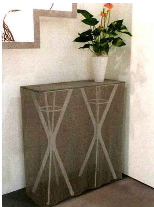
Zoom sur la cotte de mailles

Depuis quelques années, la cotte de mailles sert aussi à fabriquer des pièces de mobilier. Une illustration ici avec cette console dessinée par Pascaline Barèges.