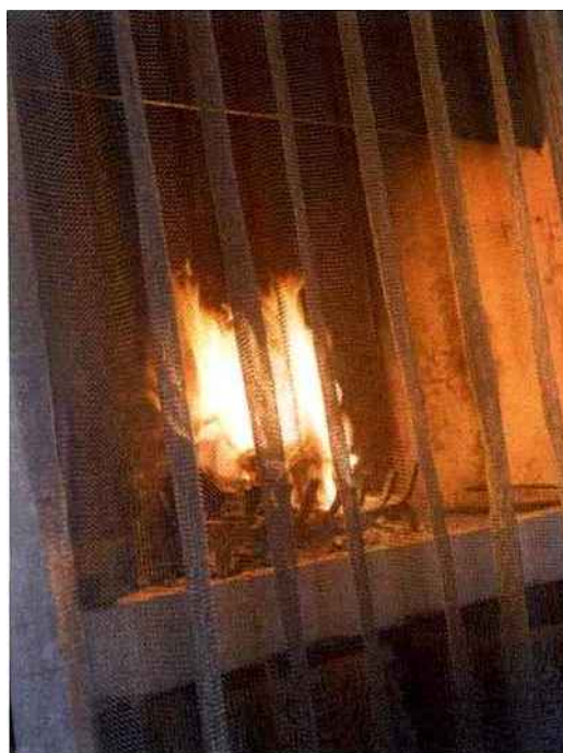
Zoom sur la cotte de mailles

La cotte de mailles reprend ici son rôle premier de protection. Elle est installée devant une cheminée et fait ainsi blocage contre d'éventuelles projections.