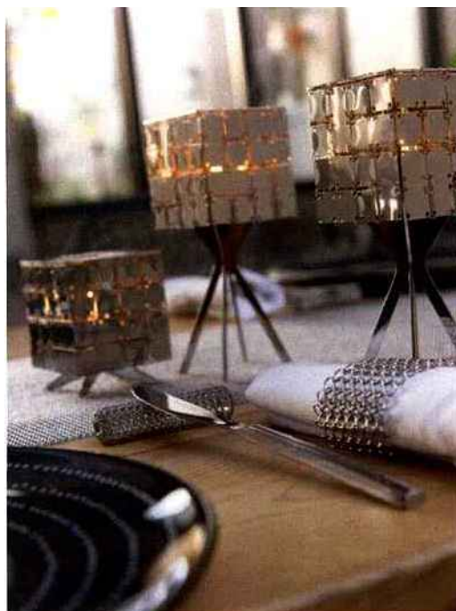
Zoom sur la cotte de mailles

La cotte de mailles est très employée dans le secteur des arts de la table. Sets de table, ronds de serviettes, chemins de table, etc. L'on peut ainsi presque arriver à faire une table entière en cotte de mailles !