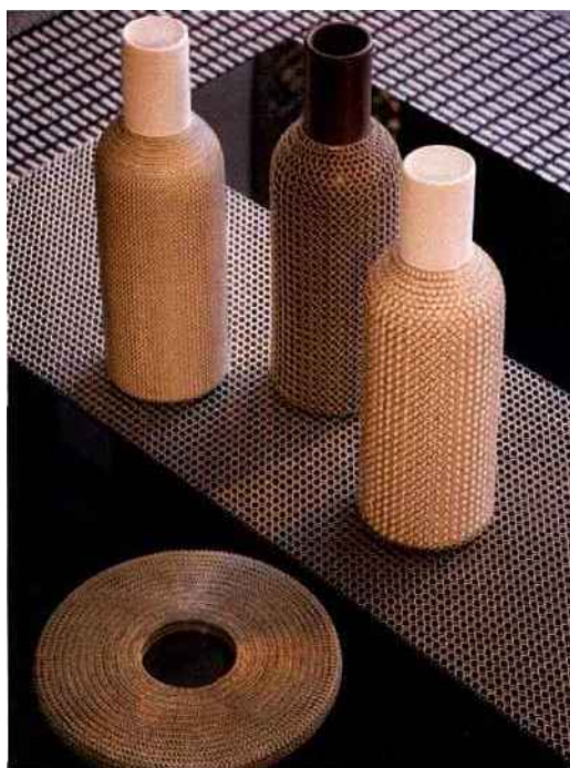
Zoom sur la cotte de mailles © Le Labo Design

Coussins, vases, vide-poches, carafes... La cotte de mailles se fait également une place dans nos intérieurs via de petits accessoires de décoration.