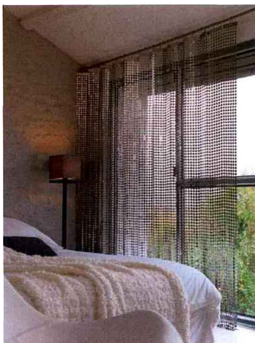
Zoom sur la cotte de mailles

La cotte de mailles vient ici habiller une fenêtre. Elle se présente sous la forme d'un rideau ajouré qui filtre la lumière naturelle tout en protégeant des regards extérieurs et donne à la pièce un cachet particulier.