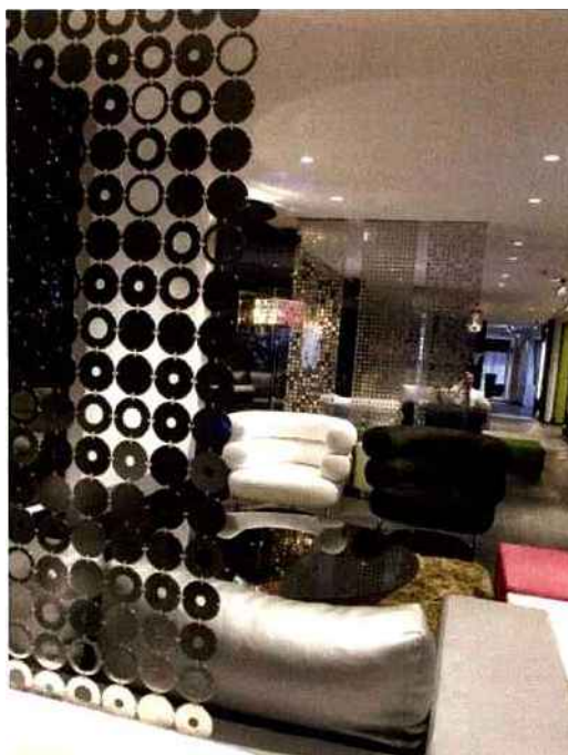
Zoom sur la cotte de mailles

La cotte de mailles est désormais disponible sous la forme d'un textile au m 2 . L'on peut donc en faire des panneaux de grandes dimensions constitués de plaquettes qui aident à organiser l'espace. A l'instar de n'importe quelle cloison légère, elle structure ici la pièce en différentes zones. Pratique pour séparer sans cloisonner !