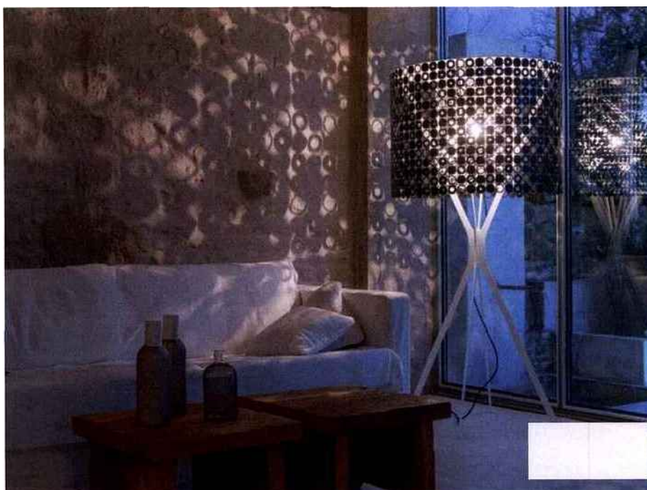
Zoom sur la cote de mailles

La cote de mailles sert ici à fabriquer l'abat-jour d'un lampadaire. L'on remarque que la cote de mailles crée des effets d'ombres et des jeux de lumière particulièrement intéressants, surtout sur des murs bruts comme ici.