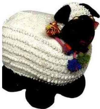
Mouton en laine « Choupinette », 30 x 27 cm, 95 €, Rouge Garance.