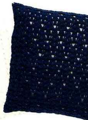
Coussin « Askim », 100 % polyester, 45 x 45 cm, 9,90 €, Cocktail Scandinave. Coussin « Croched », bleu nuit/sable, 100 % coton, 40 x 40 cm, 54 €, BoConcept.