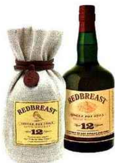
Single Pot Still, 12 ans d'âge, 40 %, 58 €, Redbreast.