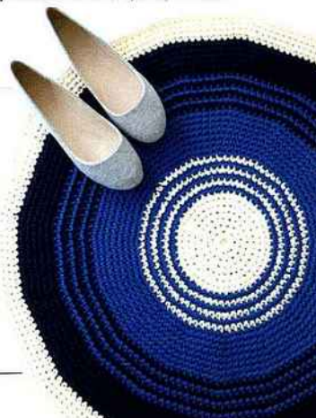
Do it yourself! Tapis de bain au crochet en Phil Corde, points maille en l'air, 51 €, Phildar.