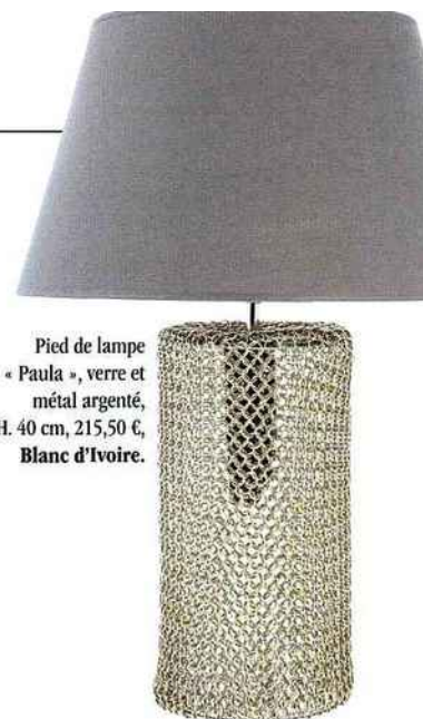
Pied de lampe « Paula », verre et métal argenté, H. 40 cm, 215,50 €, Blanc d'Ivoire.