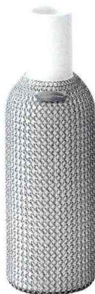
Carafe habillée de mailles en inox, H. 30 cm, 100 cl, 106 €, Le Labo Design.