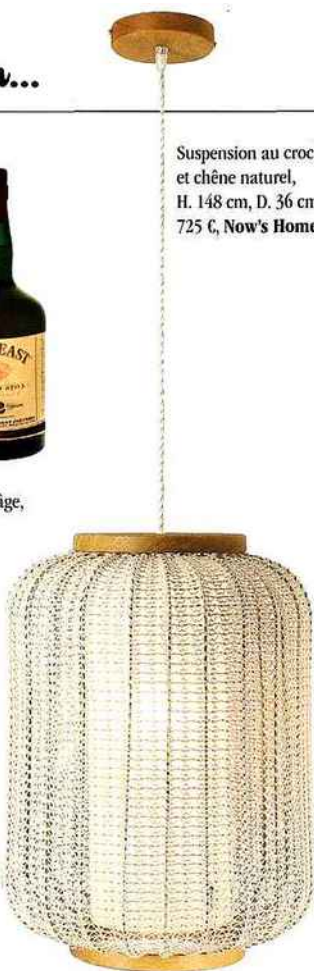
Suspension au crochet et chêne naturel, H. 148 cm, D. 36 cm, 725 €, Now's Home.